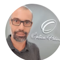
Laércio Óptica Pelinca

“Estou muito satisfeito com o atendimento prestado através do suporte técnico, a equipe de treinamento foi bem atenciosa e o sistema é bem intuitivo. Parabenizo toda a equipe Kero Ótica.”